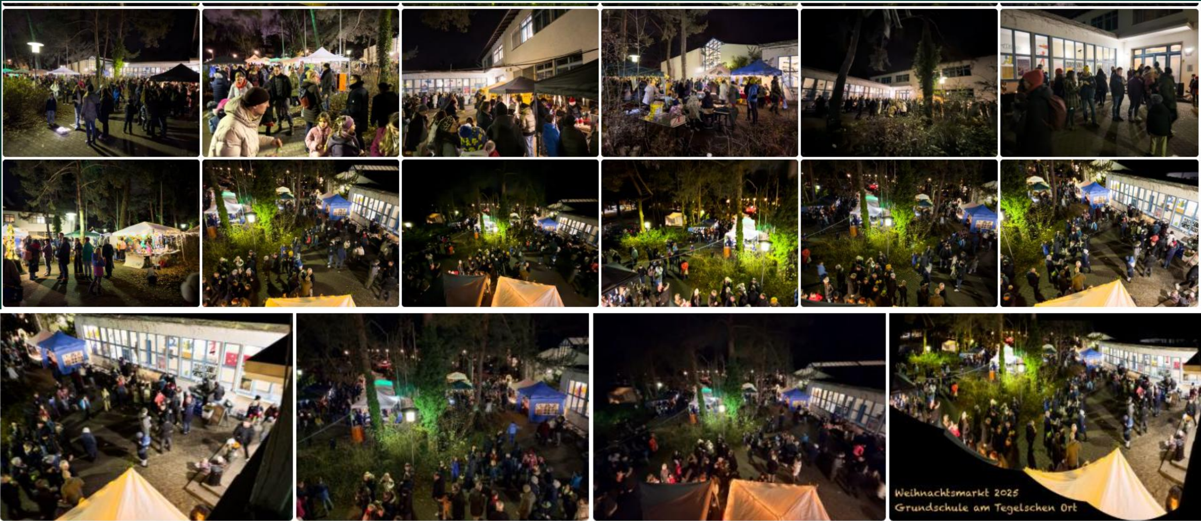
Weihnachtsmarkt 2025 Grundschule am Tegelschen Ort